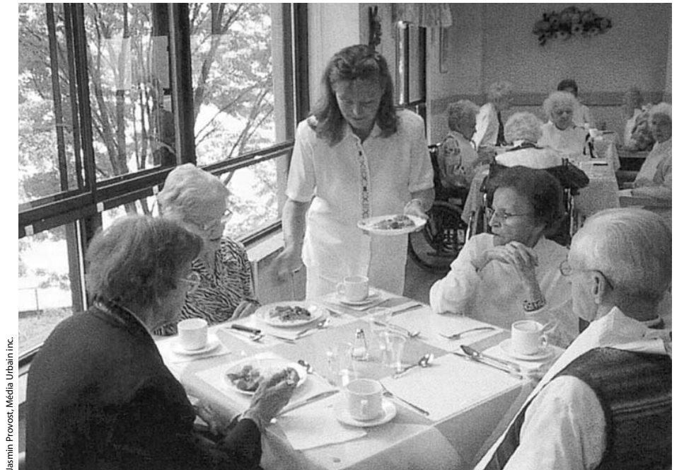
Quelques résidents attablés pour le dîner dans une unité de vie.

posés aux bénéficiaires et d'infirmières 24 heures par jour, 7 jours par semaine, les repas pris sur les étages pour certains résidents, des activités en plus petits groupes sont quelques exemples des adaptations requises pour répondre adéquatement aux besoins actuels et futurs des résidents. De plus, on privilégie la formation du personnel aux besoins spécifiques de cette