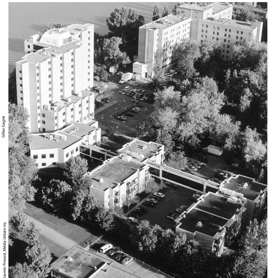
Vue aérienne des passerelles.

En assurant la pérennité de son action dans le secteur de l'habitation, la Fondation témoigne de sa fidélité au vœu de sa fondatrice.❖