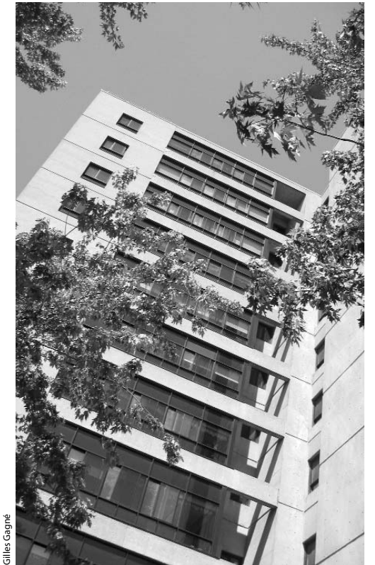
Photo en contre-plongée de la Résidence.

d'activité de l'organisation. Elle répond ainsi le plus adéquatement possible aux divers besoins et au mieux-être des personnes âgées, ce qui correspond aux objectifs visés par sa fondatrice. »