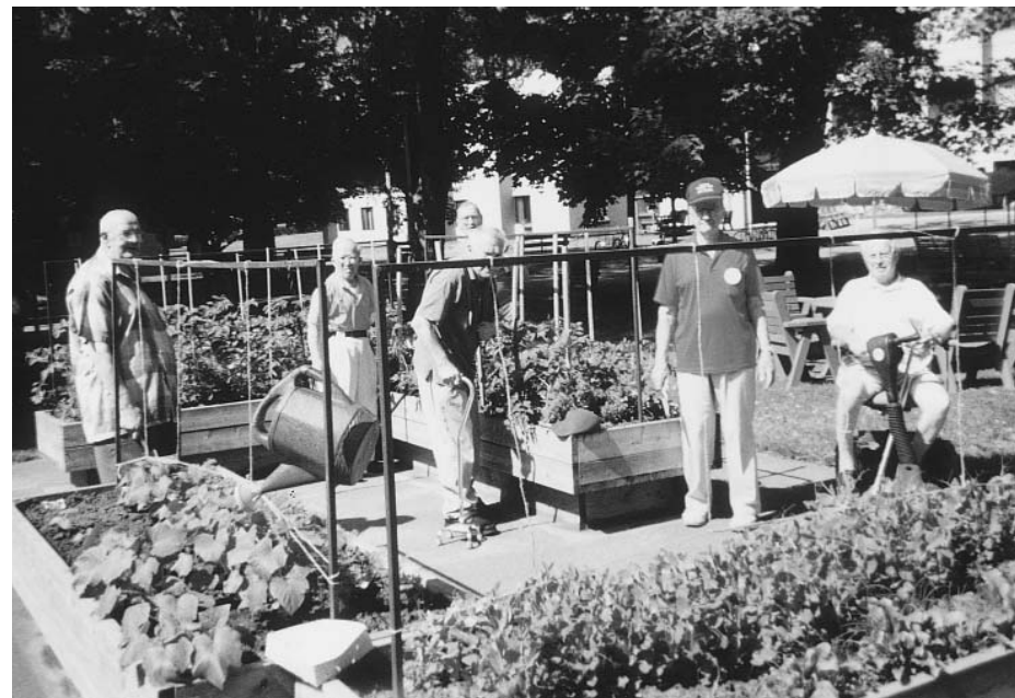
Les jardinets ont été adaptés pour plus de commodité et de plaisir.

Présidente du conseil d'administration de la Résidence de 2000 à 2002.