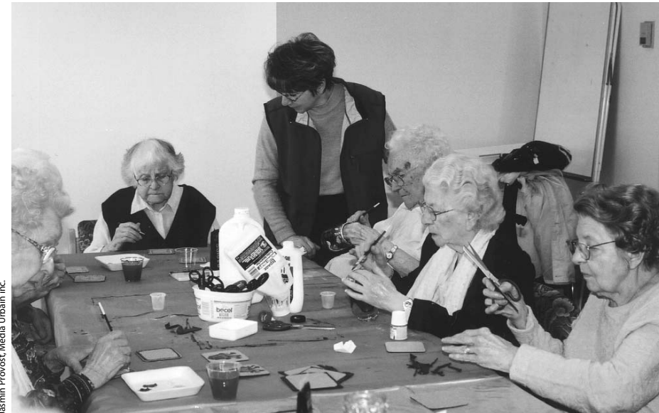
Une activité d'arts plastiques réunissant des résidentes dans une unité de vie.

Avec tous les changements survenus au cours des dernières années, une réflexion en profondeur sur la mission, les valeurs, la philosophie d'intervention et la philosophie de gestion s'imposait. Dans le cadre d'un projet entériné par le conseil d'administration et appelé « Projet d'établissement », une consultation d'envergure est menée en 2001 auprès des résidents, de leurs proches, des employés et des bénévoles, tous parties prenantes du mieux-être des résidents. Un plan