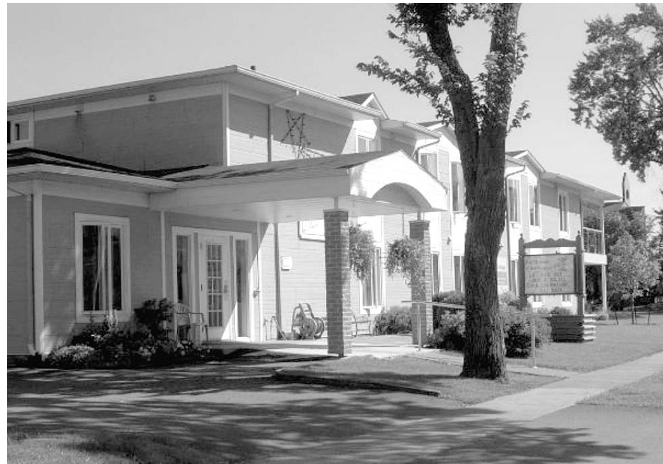
La Maison d'un Nouvel Élan, située à Jonquière, est parmi les premiers OSBL d'habitation à bénéficier du soutien financier de la Fondation.

En 1999, la Fondation élargit ses critères d'admissibilité pour inclure les activités des Sociétés Alzheimer et en 2000, elle établit les conditions d'admissibilité des projets à caractère intergénérationnel. L'année suivante le Club des petits déjeuners du Québec a retenu l'attention des membres qui y voient depuis l'occasion de jouer leur rôle de grands-parents.