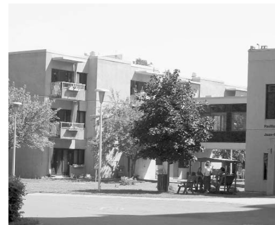
Une des passerelles reliant les logements à la Résidence.

Aujourd'hui encore les Résidences Roch-Pinard sont destinées à une clientèle d'aînés autonomes désirant vivre dans un milieu accueillant, sécuritaire et dynamique. Les Résidences Roch-Pinard ont obtenu deux roses d'or, attribuées par le Programme d'appréciation des résidences privées initié et coordonné par la FADOQ Mouvement des aînés.