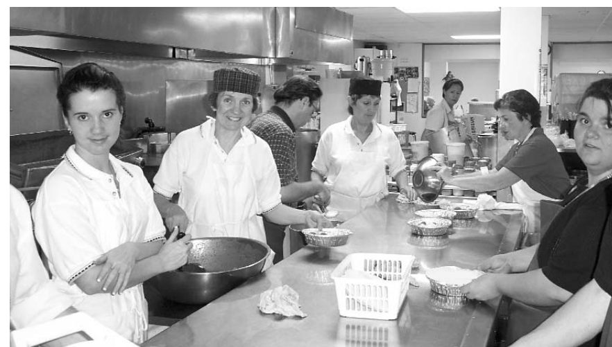
L'équipe de la cuisine de Sercovie (Sherbrooke) préparant les repas pour la popote roulante.

La Fondation ayant progressivement développé une sensibilité aux questions de formation et d'information, tant pour les intervenants que pour les bénévoles, elle a appuyé de façon ponctuelle la