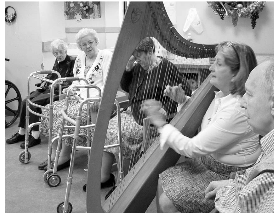
Des résidents participant à une séance de musicothérapie.

« La Résidence recherche l'excellence avec l'appui de la Fondation, elle se situe en complémentarité avec les autres secteurs