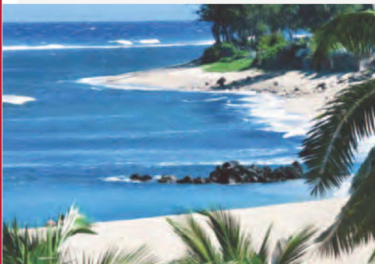
Magnifique plage de l'Île de la Réunion