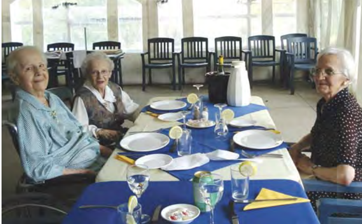
Un succulent repas accompagné de partages et d'un bon vin