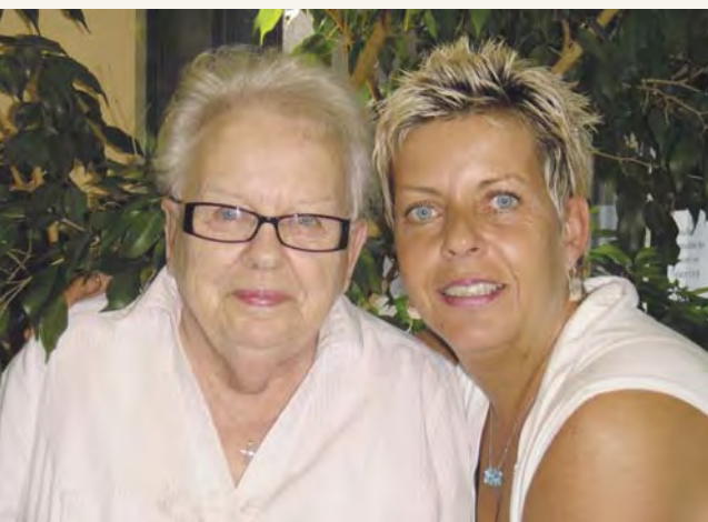
Mère et fille, un même sourire