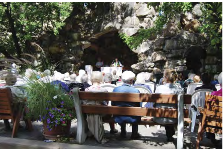
Moment de recueillement en pleine nature

Joëlle St-Arnaud , intervenante en soins spirituels